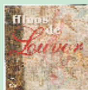
Arranjos Vocais (Músicas 1-26) Hinos de Louvor