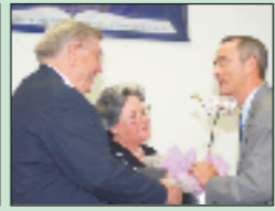
Recepcionando os “Alexanders”