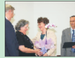
Homenageando os “Wells”