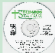
Arranjos Vocais Minicoral 04