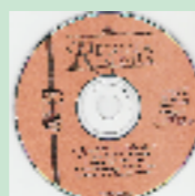
Arranjos Vocais Minicoral 03